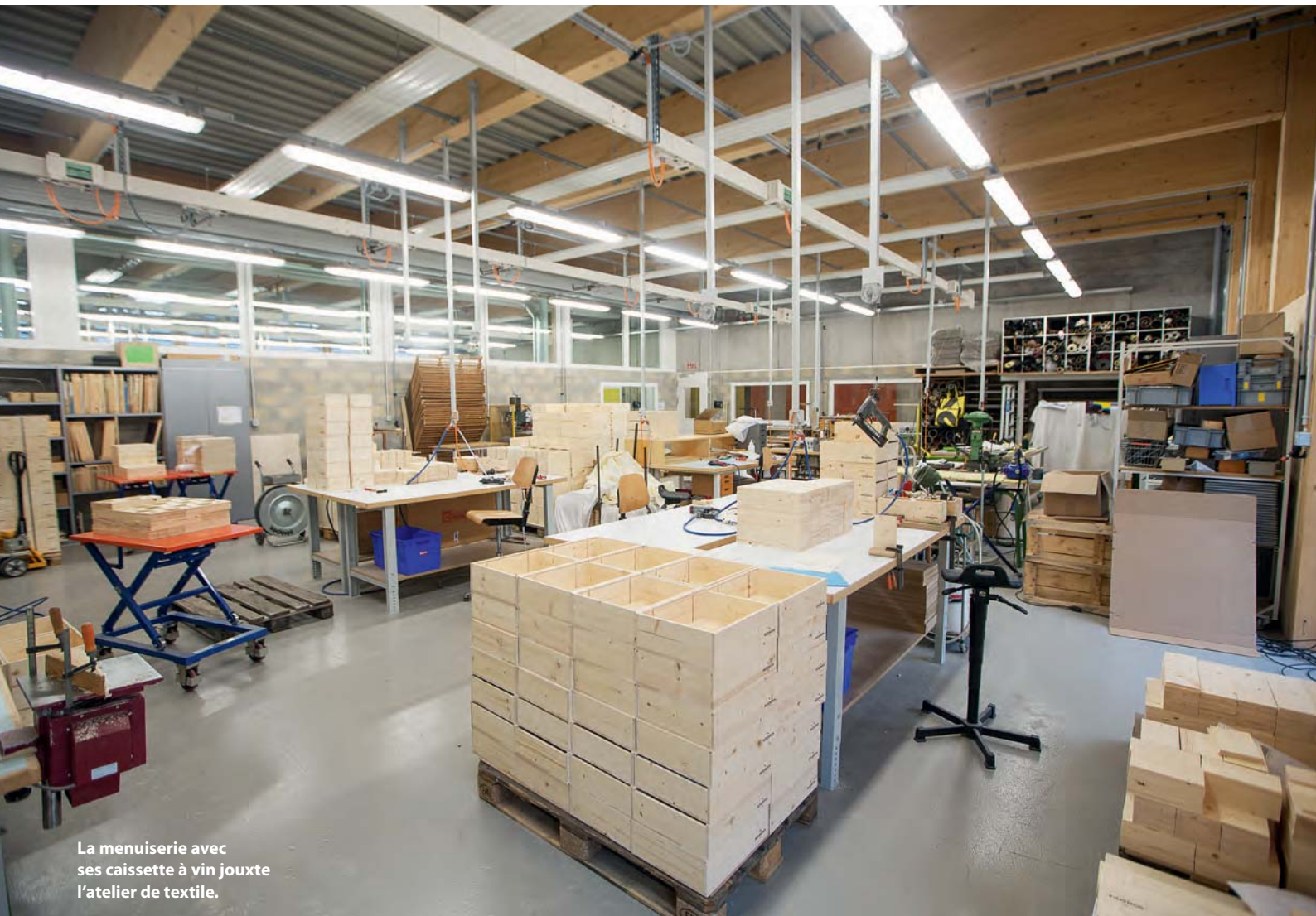
La menuiserie avec ses caissettes à vin jouxte l'atelier de textile.