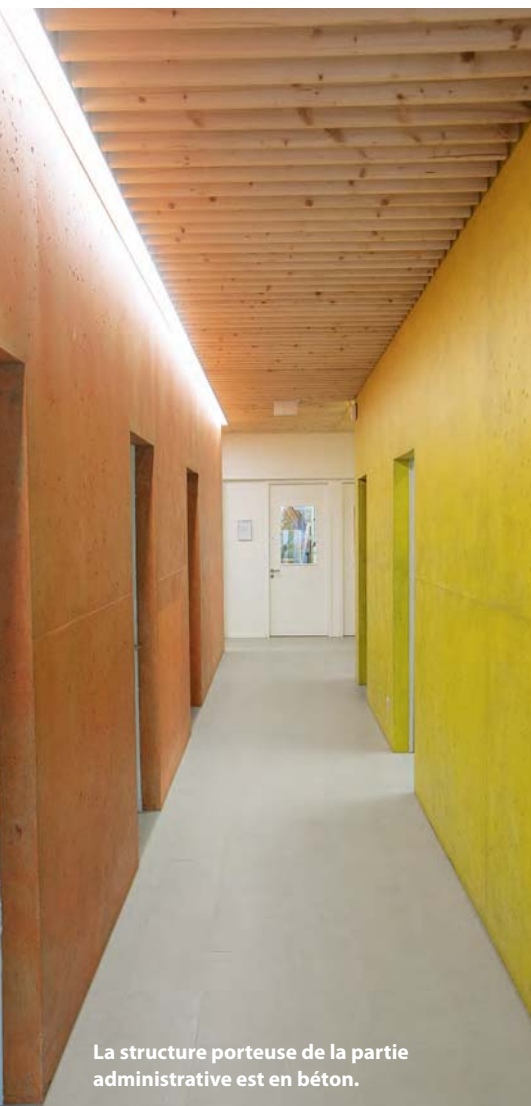
La structure porteuse de la partie administrative est en béton.